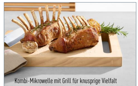
Kombi-Mikrowelle mit Grill für knusprige Vielfalt

Mit der neuen Grill-Kombi-Mikrowelle NN-GD35 ermöglicht Panasonic den preisbewussten Einstieg ins gesunde Dampfgaren. Das neue Zubehör, der Dampfgarer, macht aus dieser Inverter-Mikrowelle ganz einfach ein cleveres Dampfgargerät. Damit bietet es alle Möglichkeiten des nährstoffschonenden Garens mit Wasserdampf. Zusätzlich können jetzt auch schnell leckere Fisch- und Muschelgerichte, Risotto und vieles mehr gedünstet werden. Mit der praktischen PanaCrunch-Pfanne werden herrlich knusprige Pizzen, Flammkuchen oder Fleisch ganz einfach in der Mikrowelle zubereitet.