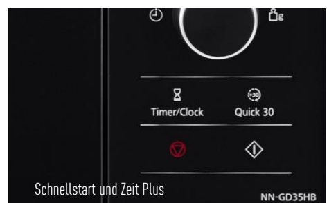
Schnellstart und Zeit Plus

Dampfgarer inkl. PanaCrunch-Pfanne – 2 in 1 Zubehör im Lieferumfang enthalten 8 Automatikprogramme zum Dampfgaren – Punktgenaue Zubereitung ganz automatisch Kombinationskochen – Mikrowelle mit Grill für schnelle, knusprige Köstlichkeiten Schnellstart mit Quick 30 – Einstellen der Garzeit auf Tastendruck in 30-Sekunden-Schritten Zeit Plus-Funktion – Ganz einfach jederzeit zusätzliche Garzeit hinzufügen Inverter-Technologie – Bis zu 30 % sanfter, schneller und energiesparender erwärmen Hochwertiges, modernes Design – Touch-Bedienfeld und Front in Klavierlackoptik