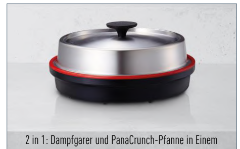
2 in 1: Dampfgarer und PanaCrunch-Pfanne in Einem