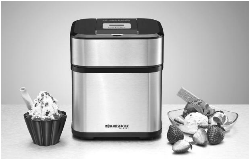
IM 12 Eismaschine 4-in-1 Ice cream maker 4-in-1